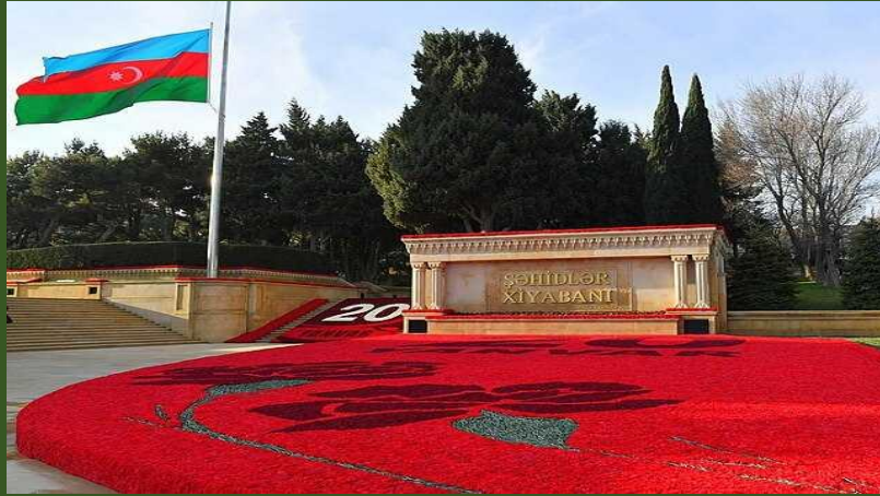
Azerbaycan. “ŞEHİTLER XİYABANI”.

Tarihe “Kara Ocak” adı ile geçen katliam 1990. Yılın Ocagında 19’unu 20 ‘sine geçen gece Sovyet Ordusunun Azerbaycan SSC’nin başkenti Bakü’ye girmesiyle gerçekleşdi. 19’ unu 20’ sine geçen gece Ermenistan’ın kışkırtması üzerine Sovyetler Birliği askerlerinin Bakü sokaklarında savunmasız sivil halka karşı büyük katliamı, soykırımı hayata geçirilmiş, sonuç olarak o kanlı gecede 117 adam hayatını itirmiş , 744 adam yaralanmış , 200 ev, 80 araba aynı zamanda acil ambulanslar, devlet ve şahsi mülk mahv edilmiştir. Çocuklar , yaşlılar , kadınlar katledilmişti.