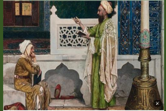
Yeşil Cami'de Kuran Dersi adlı tablo