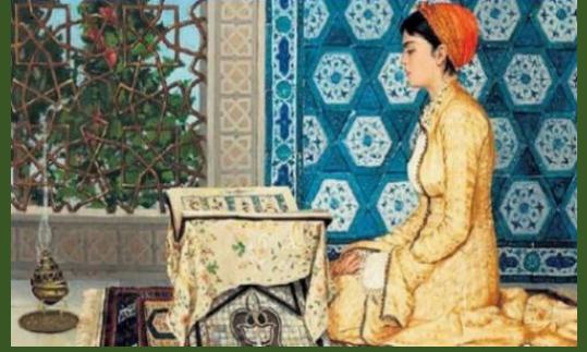
Kur'an Okuyan Kız