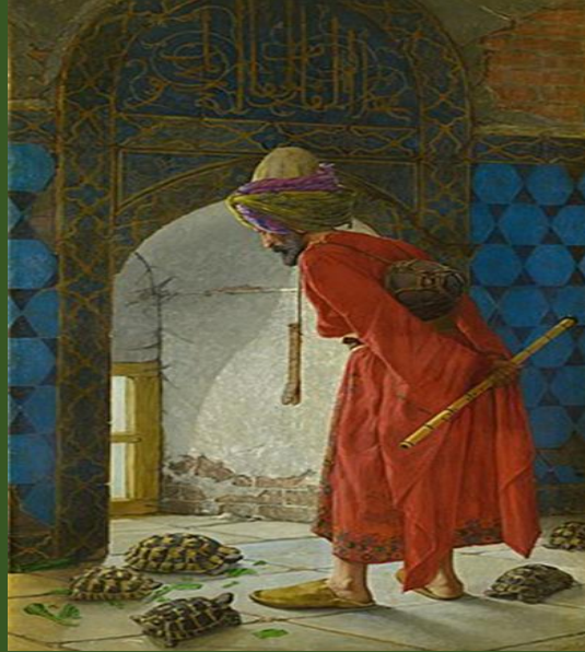
Osman Hamdi Bey'in Kaplumbağa Terbiyecisi Tablosu

En ünlü eseri ise "Kaplumbağa Terbiyecisi" eseridir.