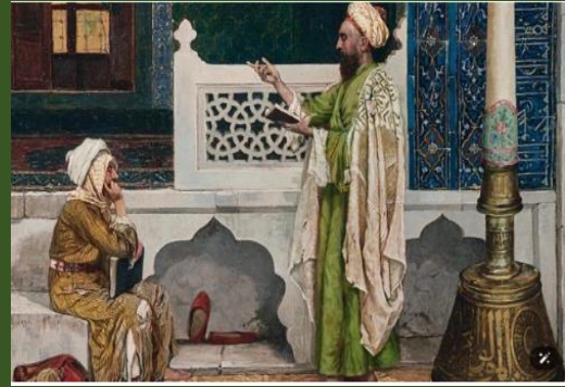
Yeşil Cami'de Kuran Dersi adlı tablo