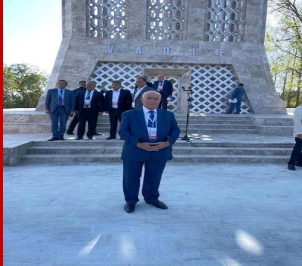
Şuşa'da Vagif Şiir günleri