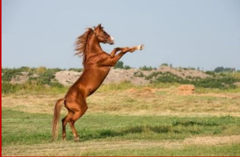
Azerbaycan. Karabağ atı

Karabağ atı, Azerbaycan'ın Karabağ bölgesinde yaratılmış ve yaygınlığı olan bir dağ binme atı türüdür. 17.-18. yüzyıllarda Karabağ Hanlığı'nda bu at cinsi daha da geliştirilmişti. Karabağ atları, Asya ve Kafkaslar'daki en eski at cinsi olarak kabul edilir. Karabağ atı şu anda Azerbaycan Cumhuriyeti'nin milli at cinsidir. (1) (Azerbaycan Cumhuriyeti At Yetiştiriciliği Kanunu) Karabağ atını diğerlerinden ayıran en önemli özelliği limon sarısı, altın sarısı veya parlak turuncu rengidir. Sadece Karabağ atlarına ait olan bu orijinal renkten kırmızı, altın kahverengi atlar doğmuştur. Karakteristik belirtilerinden biri bacaklarının farklı bir şekle sahip olması (beyazlık) ve alnının tepal (kaşka) olmasıdır. Bu işaretler özellikle "Geyran" tipinde yaygındır. Karabağ atlarının eski türleri "Maymun" (Khoshbakht), "Garniyirtyq" ve "Alyetmez" (Geyran) adlı aygırların torunlarıydı. "Geyran" tipinin gri kısmına "Pembe" adı veriliyordu. 19. yüzyılın ikinci yarısında Karabağ atı ile Akhaltaka atının karışımından "Take-Geyran atı" yetiştirildi. Bu atlar uzun ve hızlıydı. Karabağ atını diğer atlardan ayıran en önemli özelliği parlak turuncu rengidir. Yele ve kuyruk tüylerinin uçları kırmızimsı, koyu kestane rengindedir.