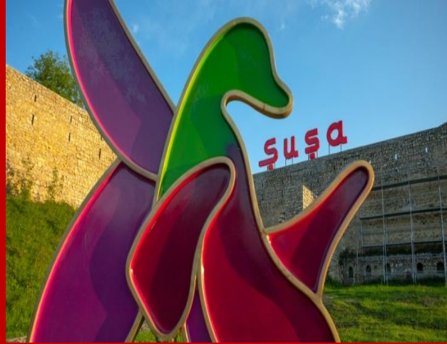
Qarabağın simvolu "Xarı bülbül"