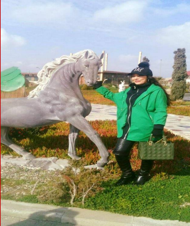
Azerbaycan .Bakü. Kale.