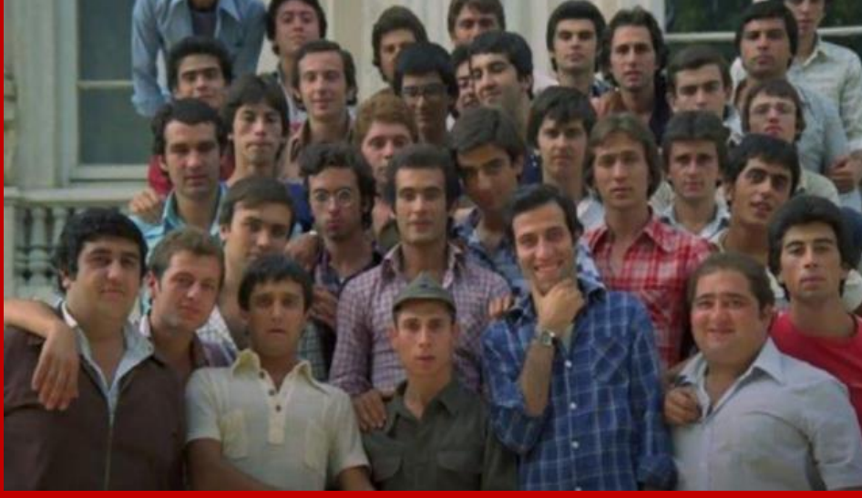
Hababam sınıfı . film

kalıcı etkisi, kültürel bir ikon olarak önemini vurgulamaktadır.