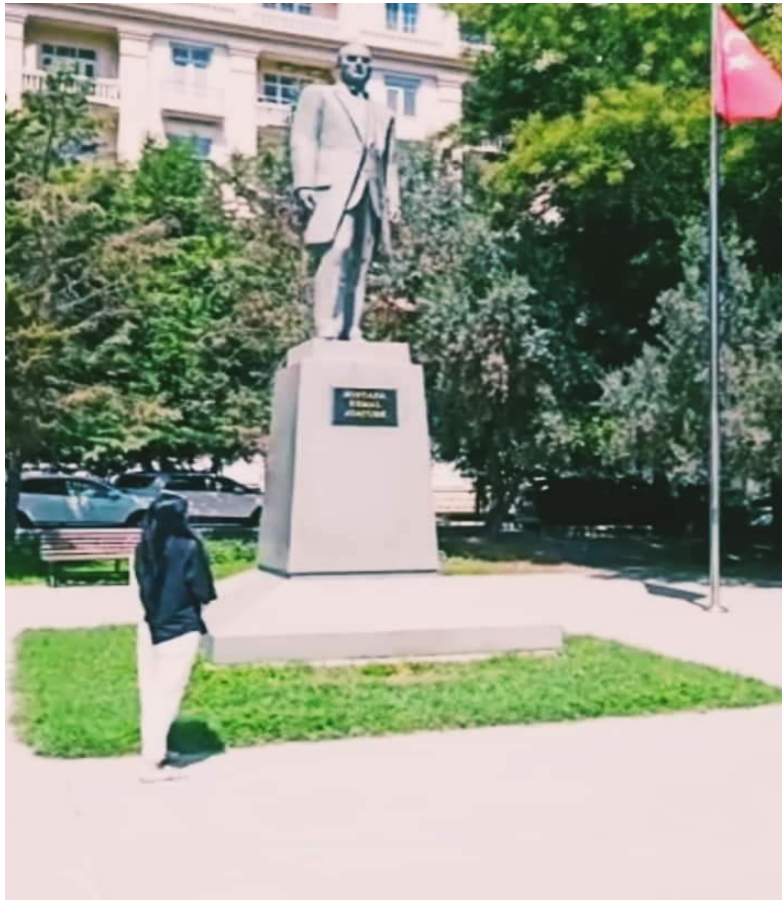
Azerbaycan. Bakü. Atatürk heykeli