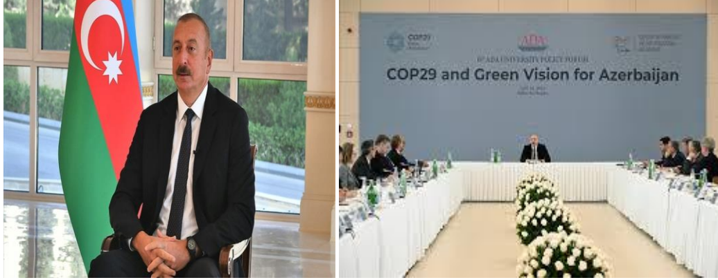
Azerbaycan Cumhuriyeti Cumhurbaşkanı İlham Aliyev

Azerbaycan Cumhuriyeti Cumhurbaşkanı İlham Aliyev; “COP 29'un Azerbaycan'da yapılması 200'e yakın ülkenin ortak kararıdır. Bu bizim uluslararası itibarımızı ve saygımızı gösteren bir faktördür”